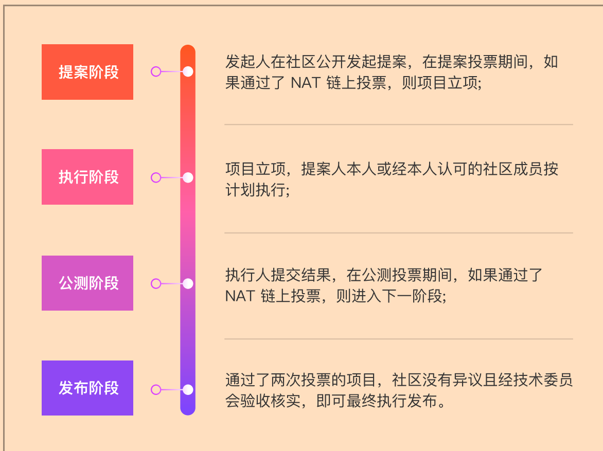
图 1: 星云链上治理通用流程图